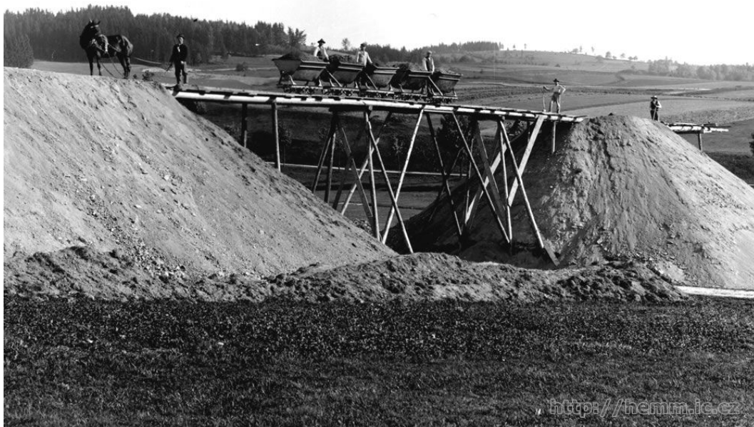
Na stavbě trati pracovali italské dělníky

Stavba byla zahájena v červnu 1901. V zájmu co nejnižších nákladů byla trať budována úsporným způsobem, takže co nejvíce sledovala terén, aby se nemusely stavět nákladné stavby, jako mosty a násypy, a tak jedinou větší konstrukcí dráhy je železný most v Brtníkách. Šetřilo se i na šterkovém podloží, oblouky měly malé poloměry, a to mělo za následek nízkou traťovou rychlost a další omezení. Jediným vodním zdrojem na trati byla studna v Panském.