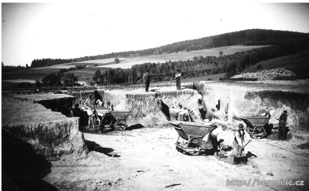
Zahájení stavby železnice v roce 1901

V době, kdy již byla vybudována základní síť železničních tratí, existovalo ještě mnoho obcí, které železnici postrádaly. Mezi nimi byly Mikulášovice, Brtníky, Křečany a Zahrady - tehdy průmyslové obce, které potřebovaly dopravovat suroviny, výrobky i pracující. Na trase zamýšlené dráhy žilo v roce 1890 téměř 20.000 obyvatel a byl v nich značný počet továren a provozů. Proslulá byla výroba nožů a nůžek v Mikulášovicích (firma Rösler) a výroba pleteného zboží v Brtníkách (firma Klinger).