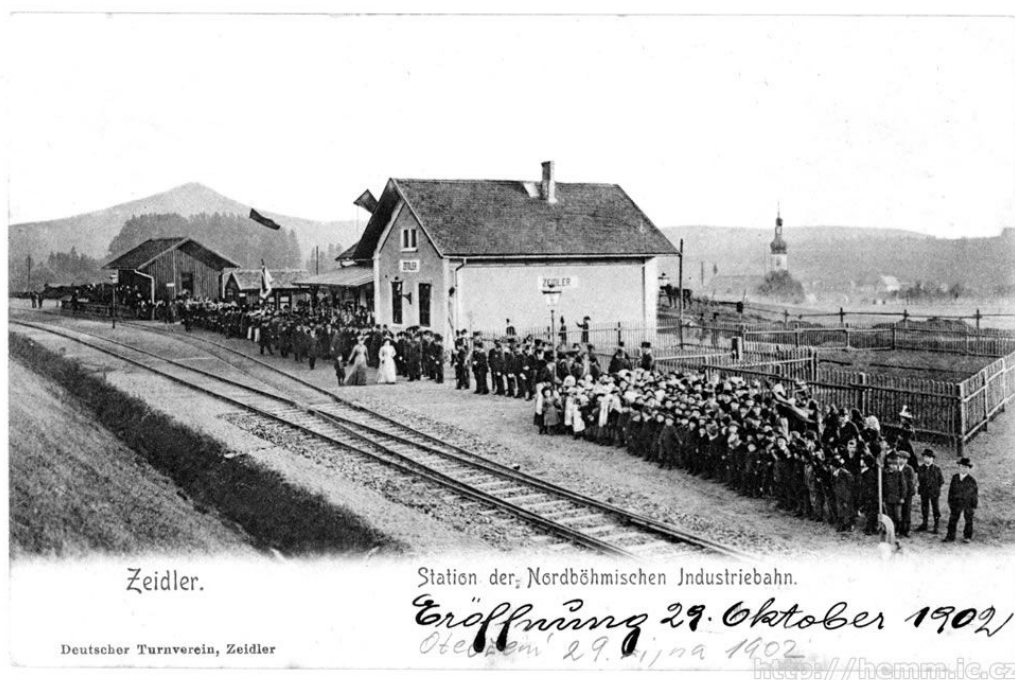
Zahájení provozu v Brtníkách 29.10.1902

Stavba byla zahájena v červnu 1901. V zájmu co nejnižších nákladů byla trať budována úsporným způsobem, takže co nejvíce sledovala terén, aby se nemusely stavět nákladné stavby, jako mosty a násypy, a tak jedinou větší konstrukcí dráhy je železný most v Brtníkách. Šetřilo se i na šterkovém podloží, oblouky měly malé poloměry, a to mělo za následek nízkou traťovou rychlost a další omezení. Jediným vodním zdrojem na trati byla studna v Panském.